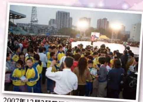
2007年12月2日帶領兆霖學校教師、學生參加葛福臨佈道大會。