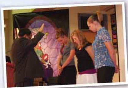
2009年9月30日崇拜： 為外籍宣教師舉行差遣禮。

今天，我要回應神的呼召，接受聖洗禮。我接受主所流的寶血，洗淨我的罪過。我立志畢生跟隨主，讓主帶領我一生的前路，遵行聖道，過榮耀神的生活。