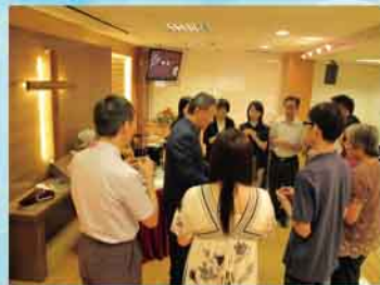
2010年10月10日戎會長主持聖餐禮

2010年1月17日本佈道所舉行了第一次教友大會，通過會章及選出第一屆執事。同年3月14日，路德會恩光堂舉行了獻堂禮，第一屆執事正式就職。當年亦聘請了全職的傳道人，深化堂校福音工作，也先後舉行了兩次的三福培訓班及第二屆中一家長班。而10月10日更有第四次的聖洗禮。家長和教師、執事和教友在這多年來蒙主帶領，眼見教會日漸茁壯，感恩之餘亦定下「同心合意，興旺福音」的目標。