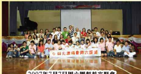
2007年7月7日周六團契首次聚會

為配合學校生命教育發展，凝聚學生、家長、老師及校友以推廣學校福音事工。校長與一班有心志的基督徒同工將每周一次的家長查經班發展為周六團契，同時又可支援學校德育和學生靈命發展。周六團契主要以學生、老師、家長、校友及區內人士為對象，第一次聚會為2007年7月7日，就猶太人而言，7代表完全，我們亦深信這是神所命定的日子。