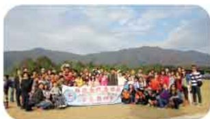
於錦田鄉村俱樂部之大合照

該校家長教師會於2013年12月8日舉行了「海陸空親子旅行」，各位參加者均享受是次行程。