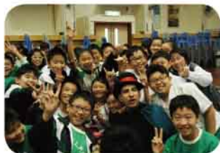
同學們與話劇演員愉快合照

該校為語常會(SCOLAR)之“English Alliance”成員，參加了“Moving Theatre for Primary School”活動，於2013年11月19日邀請了Shakespeare4All機構的演員到校演出話劇“The Taming of the Shrew”，演出非常精彩，學生加深了對英語話劇的認識。