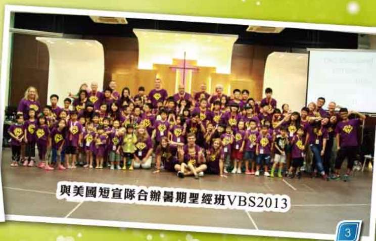
與美國短宣隊合辦暑期聖經班VBS2013