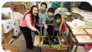
師生們一起到街市收集食物

為響應惜食文化，該校共9名學生於2013年12月參加了「街市食物回收團」。同學在為弱勢社群回收食物的過程中，深刻體會到社會資源分配不均的情況。