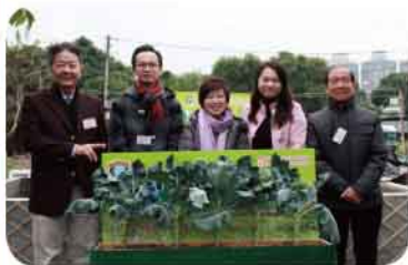
主禮嘉賓進行開幕拔菜儀式