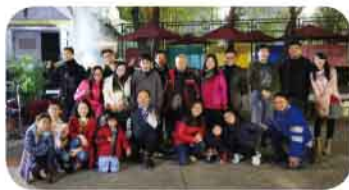
平安夜聖誕音樂福音聯歡會大合照

2013年12月24日該校與沐靈堂合辦「聖誕音樂福音聯歡會」及「聖誕報佳音」活動，超過七十位同學和家長報名參與，當天除了佈道會及詩歌，還有美食分享，氣氛熱鬧及歡愉，並得街坊掌聲支持。