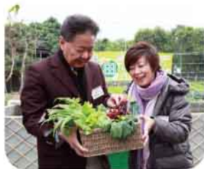
雷總監致送戎會長農田出產作為紀念品