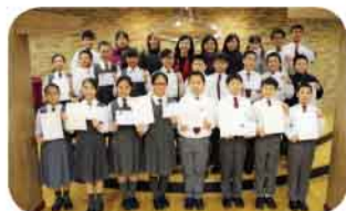
多名六年級學生考獲優異成績

該校21名六年級學生參加國際考試，成績優異。劍橋英語：基礎第三級考試Flyers：7名學生考獲11至13個盾牌(15個盾牌為滿分) 世界數學測試：數學科考獲3優2良(考獲優等獎為全球10%的考生)，解難分析科考獲3良 SPC少兒普通話水平測試：6名學生考獲A級，6名學生考獲B級