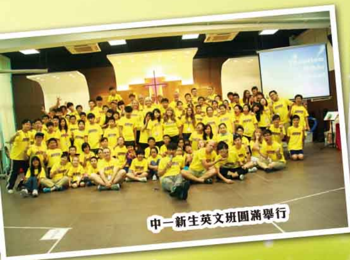
中一新生英文班圓滿舉行