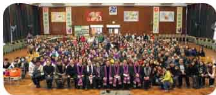
「以馬內利」聯堂崇拜大合照