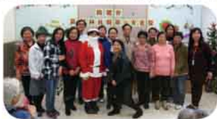
聖誕聯歡慶祝大合照