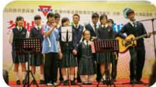
荃城社區共融嘉年華，同學們落力演出

該校15位高中同學在2013年12月7日，於愉景新城參加由荃灣區公民教育委員會主辦之「荃城社區共融嘉年華」，表演話劇及唱歌，內容講述不同種族學生如何共融，表現精彩，受主辦單位讚揚。