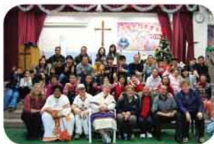
團契會友與美國來賓大合照

該校於2013年12月15日舉行之堂校協作校友團契聚會，除多位師生出席外，更邀得來自美國之宣教士帶同當地弱能人士出席參與，同頌主恩。