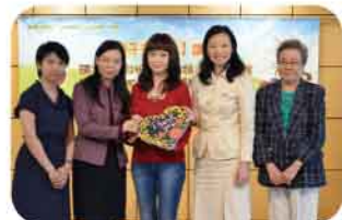
鄧藹霖女士與三位校長及家教會主席合照

該校與深培幼稚園及明我幼稚園於2013年11月23日舉辦聯合家長講座「親子交響曲」，邀請到著名電台節目主持人及播音員鄧藹霖女士主講，講者表達精彩、生動，獲家長一致好評。